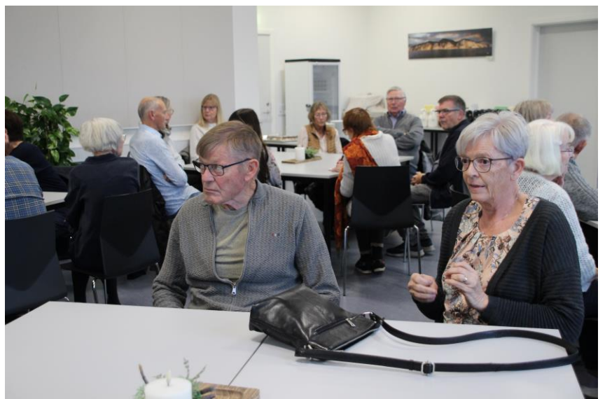
Fotos fra 1.november om kost og Parkinson