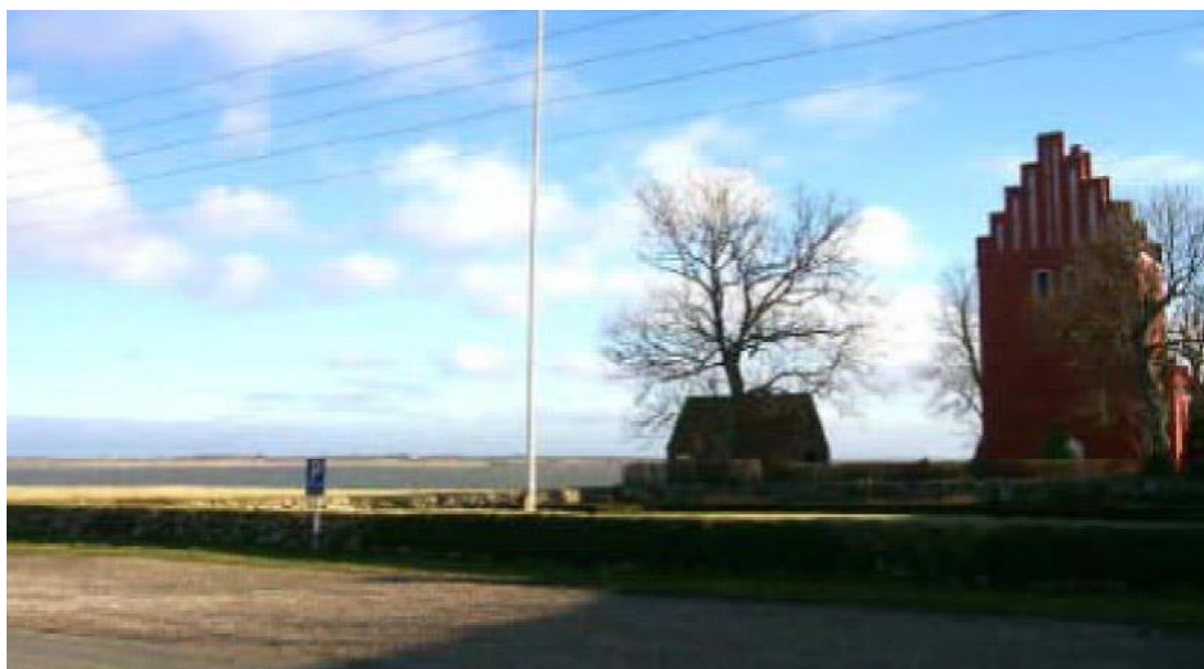
Gershøj Kirke ved Roskilde Fjord

MARGRETHEHUSET er på 93 m 2 og ligger i et fritidsområde på en 1200 m 2 dejlig grund, 500 meter fra Roskilde Fjord. Alle veje i området er asfalterede veje, stier er i overvejende grad med fast overflade, små stigninger og derfor egnede for kørestole.