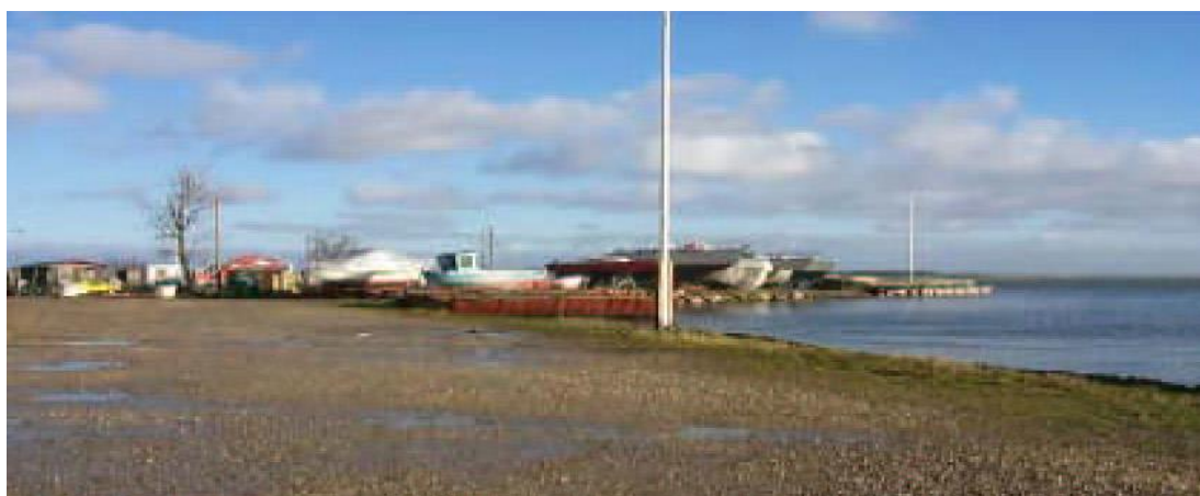
Det idylliske fiskerleje ved Gershøj Havn