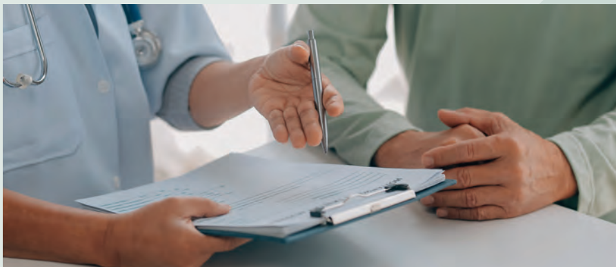
Forsikring i forbindelse med sygdom som parkinson kræver altid lægelig dokumentation. I praksis er udfordringen ofte at dokumentere den nedsatte erhvervsevne. I nogle tilfælde lægger forsikringsselskabet sig op ad jobcenterets vurderinger og arbejdsprøvnings forud for fx fleksjob eller førtidspension.