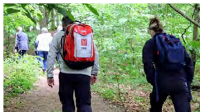
En solid vendelbo-gåtur på fire km bød på udfordringer i Tolne skovs flotte bakker gennem lysegrøn skov. Heldigvis var en Falck-rygsæk med på turen, hvis uheldet skulle være ude.