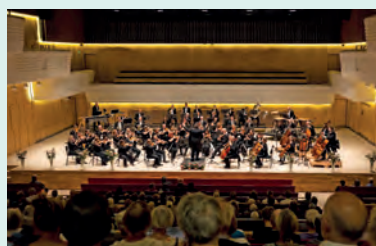
Højskoleopholdet byder blandt andet på en en flot koncert med Sønderjyllands Symfoniorkester i Alsion ved Alssund.

Tilmelding og information: Skolens hjemmeside: ronshoved.dk (her kan du også se det detaljerede program). Kontakt: 74 60 83 18, info@ronshoved.dk .