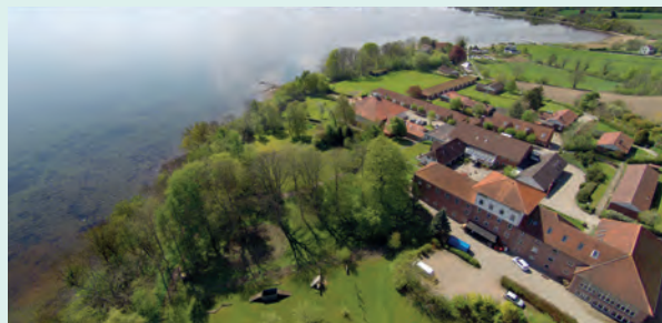
Rønshoved Højskole ligger smukt i Kruså.